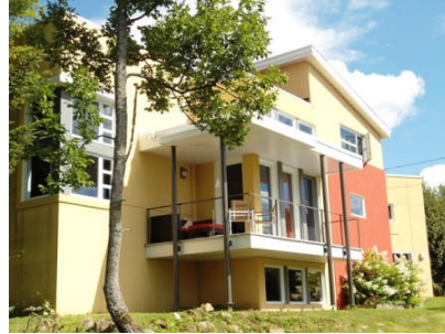
Residence/Office Charest Parenteau