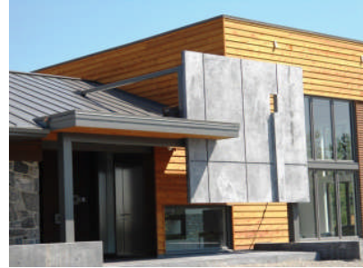
Residence Moulton Hill

Leading architects from across the length and breadth of the Americas gathered at the J W Marriott Grosvenor House Hotel, Park Lane, London, Friday (December 7th) for the announcement of the winners of the prestigious Americas Property Awards in association with the Royal Institute of Chartered Surveyors (RICS) and Yamaha.